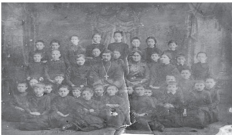
Фото 4. Учащиеся церковно-приходской школы города Якутска, начало XX века

4-я Советская школа была открыта тем же Постановлением № 4 подотдела Единой трудовой школы 1920 года из IV-го Городского училища [3]. IV городское начальное училище переименовано в 1918 году из бывшей Николаевской церковно-приходской школы, основанной в 1899 году и из Образцовой школы при Якутской духовной семинарии. Училищу были переданы архив Николаевской церковно-приходской школы, классные журналы, переписка с 1899 по 1918 годы, список учеников (фото 4) [18].