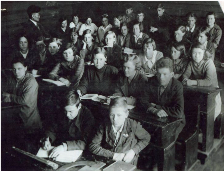
Фото 1. Ученики 4 класса начальной школы № 1 г. Якутска, 1935 год

Данная школа имеет исторические корни: В 1870 году открылось Якутское приходское училище, которое в 1906 году преобразовано в Якутское I-е Городское приходское училище, затем переименовано в I-е Городское начальное училище (за Логом), а