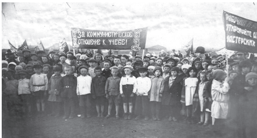
Фото 2. Пионеры 2 Советской школы на параде 1 Мая, 30-е годы