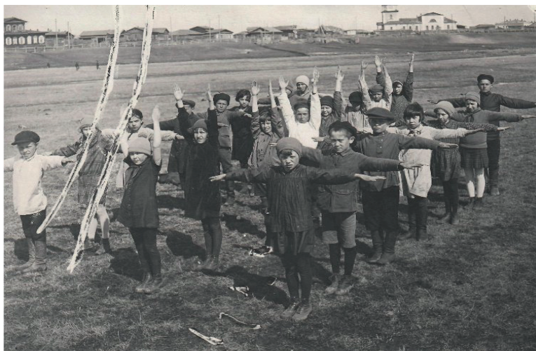
Фото 7. Урок физкультуры в русско-татарской школе, 20-е годы

В 1918 году в 9-ом городском начальном русско-татарском училище обучалось 30 учеников, из них: в 1 отделении – 11 человек; во 2 отделении – 8 человек; в 3 отделении – 11 человек. Училище находилось за логом, в доме-приюте арестанских детей [16].