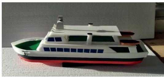
Фото 5. Судно с водометным движителем

Судно с водометным движителем использует технологию водомета для движения. Этот принцип заключается в выбросе струи воды из специальной сопловой системы на высокой скорости, что создает реактивную тягу, перемещая судно вперед. Для моделей с такими движителями, разработаны упрощенные конструкции, но при этом используют те же физические принципы.