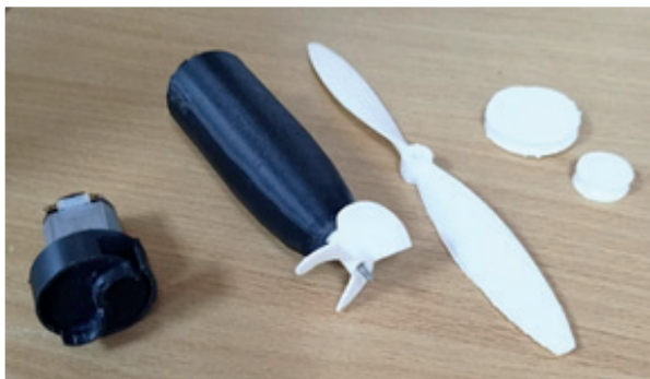
Фото 8. Детали, распечатанные на 3D принтере: водомет, гондола, воздушный винт, шкивы

Таким образом, интеграция 3D-моделирования (с акцентом на отечественный Компас-3D) и печати в программу кружка судомоделирования не только идет в ногу со временем, но и служит мощным инструментом для снижения порога входа, позволяя юным техникам сосредоточиться на творчестве, понимании физических принципов работы моделей и инженерных задачах, минимизируя разочарование от чисто технических и «ремесленных» сложностей.