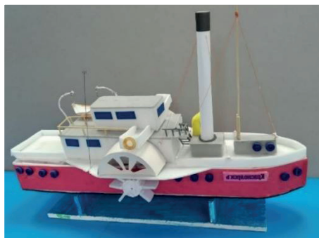
Фото 3-4. Колесный пароход