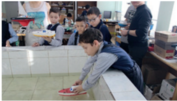
Фото 7. Участники соревнований

По данным типам моделей судов традиционно ежегодно проводятся внутрикружковые и городские соревнования (фото 7).