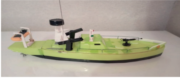
Фото 6. Судно с гребным винтом

Судно с гребным винтом использует винтовую систему для создания тяги и движения. Гребной винт сопряжен с двигателем и вращается в воде, создавая силу, которая двигает судно вперед. Такие модели судов являются сравнительно более сложными, по сравнению с вышеперечисленными, так как винтомоторная группа (винт, вал, сальник, дейдвуд, мотор) является наиболее ответственной частью в действующей модели.