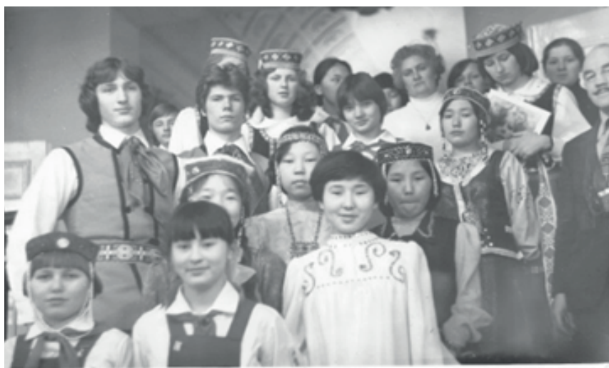
Фото 6. Клуб интернациональной дружбы «Нормандия – Неман» в школе № 2, 1965 г.