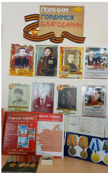
Фото 1. Уголок памяти

Воспитателями всех групп разработаны и реализованы проекты по патриотическому воспитанию «Города герои», «Мы наследники Победы», «Мы помним – мы гордимся», «Детство, опалённое войной».