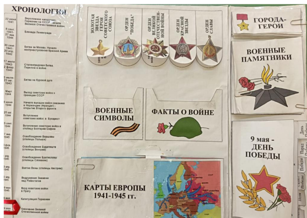
Фото 3. Лэпбук «9 Мая»