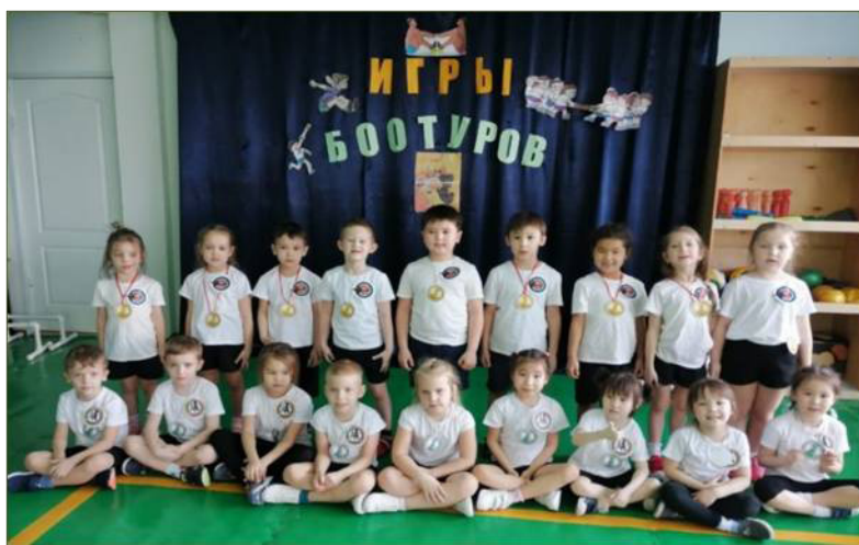
Фото 9. Игры боотуров

В системе работы по патриотическому воспитанию дошкольников большую роль играет воспитание осознанно-правильного отношения к природе. Родители своим примером должны формировать у ребенка бережное отношение к природе и ко всему живому, и с этой целью в нашем детском саду ежегодно проводится экологическая акция «Подари пернатым дом», «Птичья столовая», где дети вместе с родителями изготавливают скворечники для птиц и домик для белочки. По результатам работы акции присуждаются номинации. Благодаря таким акциям наши воспитанники приобретают первые опыт по сохранению природы и живых существ. Также дети знакомятся с традициями якутских охотников. Дети знают, что люди охотились только на то, что в чем нуждались, они охотились на пропитание и на теплую одежду, а так же о том, что в тайге были маленькие охотничьи домики, и в этом домике люди оставляли еду, спички, дрова, чтобы заблудившийся человек смог выжить, и охотники делились своей добычей.