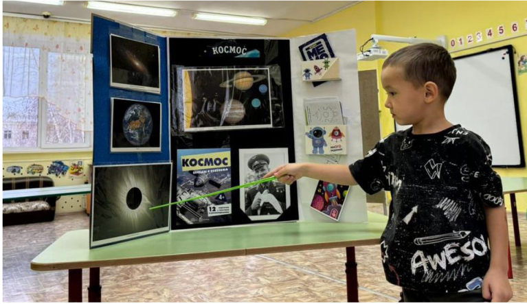
Фото 2. Лэпбук «Космос»

и работоспособным. И 12 апреля 1961 года Юрий Гагарин пробыл в космосе 1 час 28 минут и благополучно вернулся на Землю. И каждый год 12 апреля в честь полета Гагарина в космос наша страна отмечает День космонавтики. Рассказ о таких героях воспитывает у детей гордость за свой народ, за достижения великих людей и своей страны.