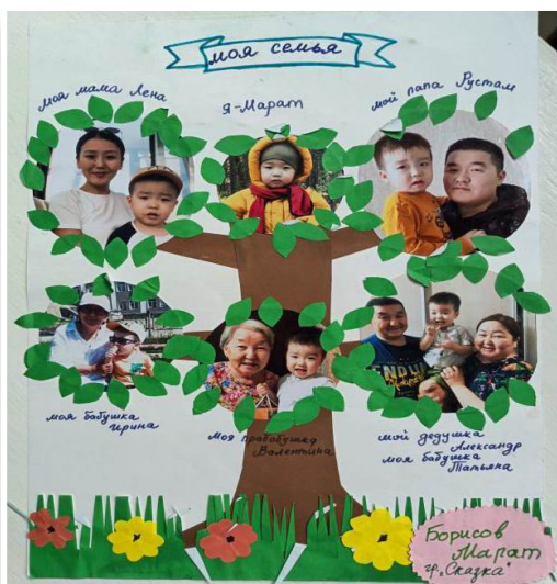
Фото 5–6. Родословное древо воспитанников