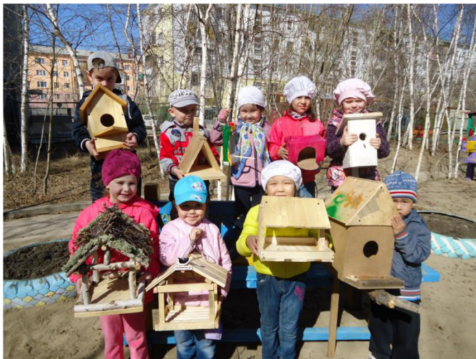
Фото 10. Акция «Подари пернатым дом»

Таким образом, через различные виды работ развиваем у дошкольников чувство гордости за свою страну, прививаем уважение к многообразию культур, воспитываем ответственность за окружающую среду своего края. Ведь основы патриотического воспитания дошкольников начинаются с воспитания любви к родному дому, семье, детскому саду, городу, родной природе, к истории и культурному достоянию своего народа, своей нации, с уважительного отношения к труженику и результатам его труда, к родной земле.