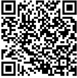
Рис. 1 – QR – код результатов работы кружка

Наконец, результаты работы кружка могут быть продемонстрированы на школьных мероприятиях или выставках, что дает учащимся возможность гордиться своими достижениями и получать положительную обратную связь от сверстников, родителей и педагогов (рис. 1).