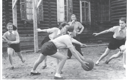
Фото 8–9. Занятия в спортивной школе, 40-е г.

Воспитанием молодого поколения в духе патриотизма, любви к Родине, стремлении к ее защите занимались и другие учреждения образования: