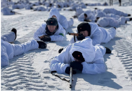
Фото 31. Постановка «Битва на Ильмене»

церах и конкурсах, Юнармейский бал Победы – всё это наполняет патриотическое воспитание духовно-нравственным содержанием. Так, постановка «Битва на Ильмене» объединила 400 участников из юнармейских отрядов, военно-патриотических клубов, воспитанников Якутской кадетской школы-интернат (фото 31–32).