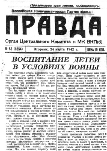
Рис. 1. Статья в газете «Правда» о воспитании детей в годы войны