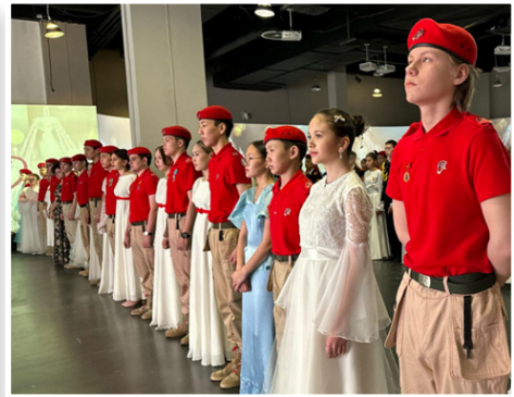
Фото 32. Юнармейский бал Победы

Большой воспитательный эффект имеют масштабные проекты и акции. Так, в рамках фестиваля «О Родине! О мужестве! О славе!» на площадках Парка Победы прошли интерактивные игры, увлекательные мастер-классы и гала-концерт, состоящий из творческих номеров педагогического сообщества школ города Якутска. Всего приняли участие более 3500 обучающихся и педагогов муниципальных образовательных учреждений города Якутска, воспитанников местного отделения Движения Первых города Якутска, Дома «ЮНАРМИЯ» и Городского детского движения «Юный горожанин».