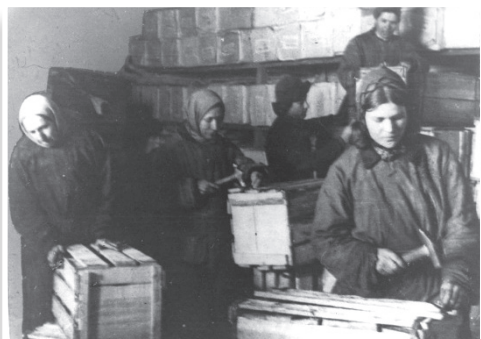
Фото 20. Упаковка подарков для фронта, 1941 г.

Коллективы дошкольных учреждений в 1941 году внесли для танковой колонны до десятидневного заработка; сдано облигаций на сумму 9 345 руб., собрано на подарки красноармейцам 336 руб., теплых вещей на 3 895 руб.