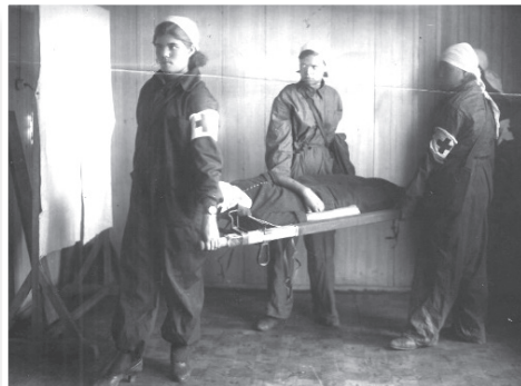
Фото 2. Санитарная дружина школы фабрично-заводского обучения