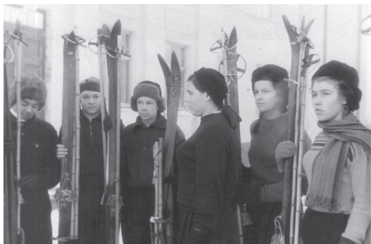
Фото 1. Школьники во время урока