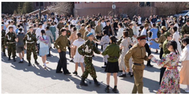
Фото 33. Вальс Победы

Масштабным мероприятием стала акция «Вальс Победы», которая соединила 5500 танцевальных пар из разных учреждений города Якутска для торжественного вальса, символизирующего победу. От системы общего образования приняли участие 3000 пар из числа обучающихся, педагогов, родителей и выпускников школ и учреждений дополнительного образования (фото 33).