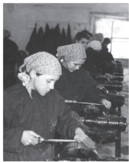
Фото 21. Производственное обучение в слесарном цеху

ление «Об открытии в Якутске ремесленного училища и школы фабрично-заводского обучения».