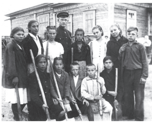
Фото 22. Школьники города Якутска на субботнике, 1943 г.

Школьников города привлекали к сельскохозяйственным работам. Из их числа создавали специальные бригады, обучали вождению на тракторах и комбайнах. Дети оказывали помощь колхозам: убирали хлеб, косили сено, обрабатывали огороды, следили за скотом (фото 22).