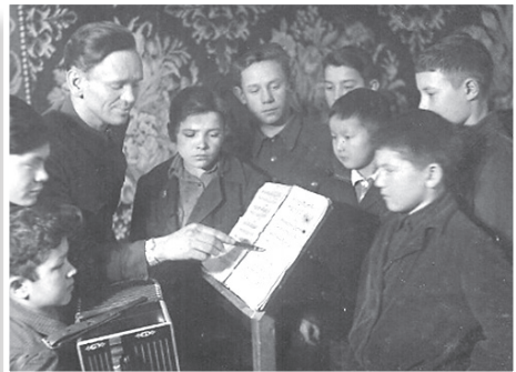
Фото 24–25. Кружки Дворца пионеров

В тяжелые годы войны приоритетным направлением Якутского городского отдела народного образования являлась забота о детях и детях-сиротах. Принимались меры по снабжению детей питанием, одеждой, обувью, учебниками, тетрадями. Дети фронтовиков, погибших на полях сражений, в первую очередь, нуждались в заботе и опеке. Их устраивали в детские сады и детдома. Большая работа проводилась по патронированию, опекунству и усыновлению детей-сирот и военнослужащих. По архивным