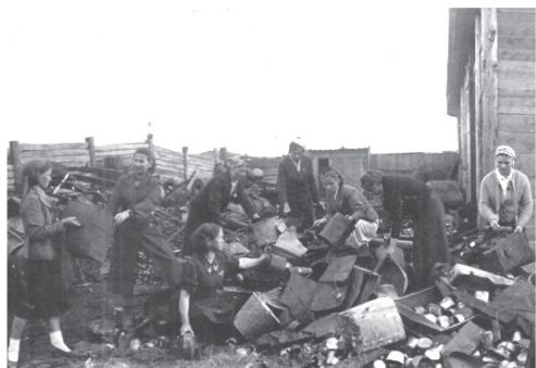
Фото 19. Сбор металлолома, 1941 г.

Так, ярким проявлением патриотизма стала добровольная финансовая помощь городского учительства государству. Школами города была проведена значительная работа по сбору средств в фонд помощи детям фронтовиков и Красной Армии. На строительство танковой колонны «Советская Якутия» внесено 118 467 руб., в фонд обороны Родины сдано облигаций на 454 697 руб., сдано с части зарплаты учителей – 2 578 147 руб., послано 66 индивидуальных посылок бойцам Красной Армии, отправлено теплой одежды 8 579 шт, сдано металлолома 93 т. 128 кг и т.д. (фото 19-20).