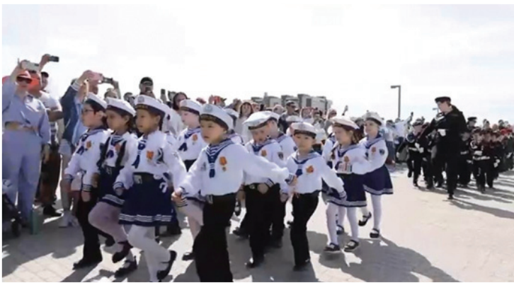
Фото 27. Детский парад Победы

С раннего возраста дети приобщаются к идеям гражданственности и любви к Родине через формирование патриотической среды в дошкольных учреждениях. Патриотические уголки, мини-музеи, театрализованные зоны, участие в памятных мероприятиях – всё это способствует эмоционально-нравственному становлению личности. Один из показательных примеров – благотворительный концерт и ярмарка 6 мая, в которых приняли участие около 500 воспитанников и родителей. Собранные средства, более 500 тысяч рублей, были направлены в фонд поддержки участников СВО. Работники учреждений муниципальной системы образования вносят посильный вклад в Фонд Победы. Также стоит отметить Детский парад Победы, ставший традицией: он прошёл 28 мая в Парке Победы, в нём приняли участие свыше 600 детей из 30 детских садов, одетых в форму различных родов войск (фото 27).