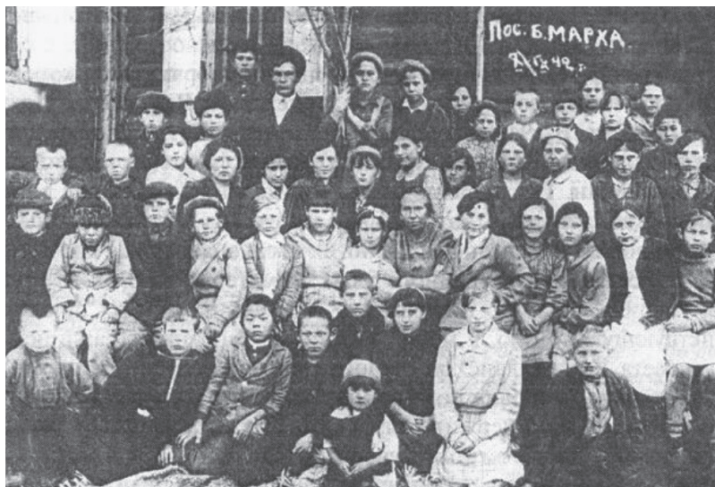
Фото 26. Учащиеся Мархинской школы, 1942 г.

Мархинский детский дом размещался в двух корпусах на улице Набережной поселка Марха (фото 26). В подсобном хозяйстве детдома имелось 5 коров, 2 лошади, 19 свиней, земельный участок под покос и огород. На 1 января 1940 года в Мархинском детском доме проживало 110 детей. Детей обеспечивали трехразовым питанием, а также каждый вечер перед сном в столовой выдавали по кружке горячего молока, по утрам и вечерам – по ложке рыбьего жира.