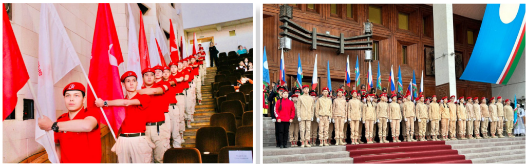
Фото 28–29. Юнармейские отряды

Особое внимание уделяется военно-патриотическому направлению. В Якутске успешно функционируют 66 юнармейских отрядов и 3 специализированных класса, координируемых Домом ЮНАРМИИ. Учащиеся вовлечены в изучение военного дела, волонтерство, медиадеятельность и туристическую подготовку. В школах работают 48 военно-патриотических клубов, объединяющих почти 1800 учащихся (фото 28–29).