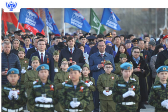
Фото 30. У мемориального комплекса «Солдат Туймаады»

События 8 и 9 мая были наполнены яркими проявлениями гражданского участия.