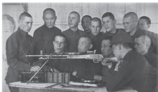
Фото 3. Занятия стрелкового кружка в школе