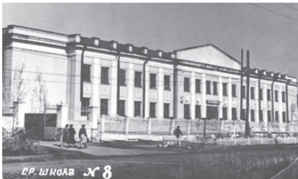
Фото 10. Новое здание средней школы № 8, 1940 г.

За период с 1941 по 1945 годы в городе Якутске построено 4 новых здания школ: для неполных средних школ № 16, Хатаской, Мархинской, средней школы № 8, укреплялась учебно-материальная база школ (фото 10).