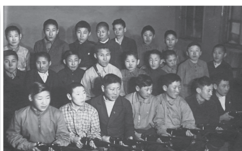
Фото 4. Ученики 7 кл. неполной школы № 2 во время урока военной подготовки

Многогранную деятельность в те годы развернули большие энтузиасты народного образования, заведующие ГОНО – Агния Петровна Геллис-Расторгуева, Илья Львович Гутин, Ефим Георгиевич Алексеев (фото 5–7).