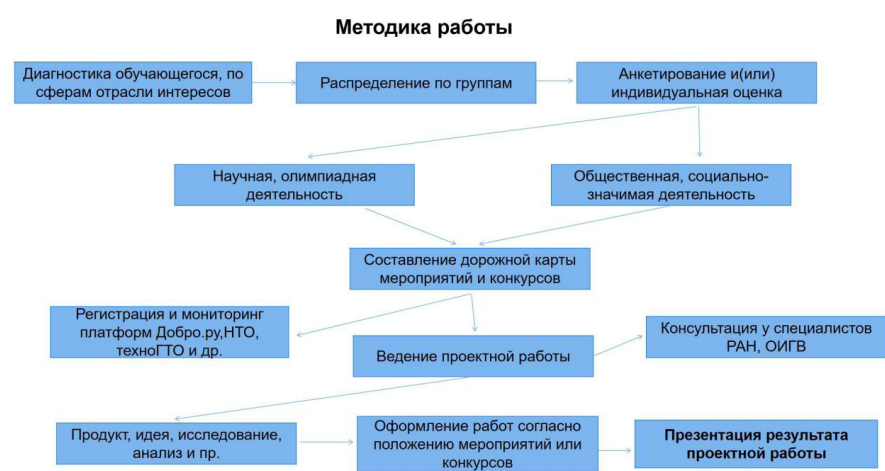
Рис. 2. Методика реализации проектной деятельности программы ДООП ДТ «Кванториум»

Основными этапами работы является определение тематики ведения проектной деятельности путем диагностики сферы отрасли интересов. Этапы работы фиксируются в виде артефактов с применением инновационных технологий в облачном пространстве для отслеживания прогрессов и регрессов ведения проектной деятельности. Педагогом кружка дополнительного образования «Наука. Техника и ГИС» ДТ «Кванториум» МАНОУ ДДТ им. Ф.И. Авдеевой организуется работа в двух направлениях – научной, олимпиадной и общественной, социально-значимой деятельности. В редких случаях обучающиеся комбинируют две разновидности проектной деятельности. Особо важным фактором в ведении проектов старшеклассников является работа во внеурочное время и следование календарному плану мероприятий.