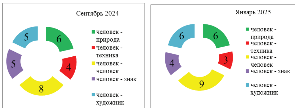
Диаграммы 1-2 – Итоги промежуточного анкетирования обучающихся ППК

Данные диагностики показали наиболее высокий процент категории «Человек – Человек» – все профессии, связанные с работой с людьми, с обслуживанием людей, с общением.