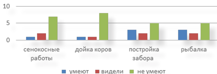
Диаграмма 1 – Результаты первичного опроса

До выезда на остров был сделан опрос старшеклассников (диаграмма 1), умеют ли они косить сено, доить коров, могли бы построить забор для животных и смогут ли выловить рыбу из реки. Большинство воспитанников интерната никогда не видели процесса сенокоса, в жизни не доили коров, но построить забор из жердей и словить рыбу – половина опрошенных смогла бы.