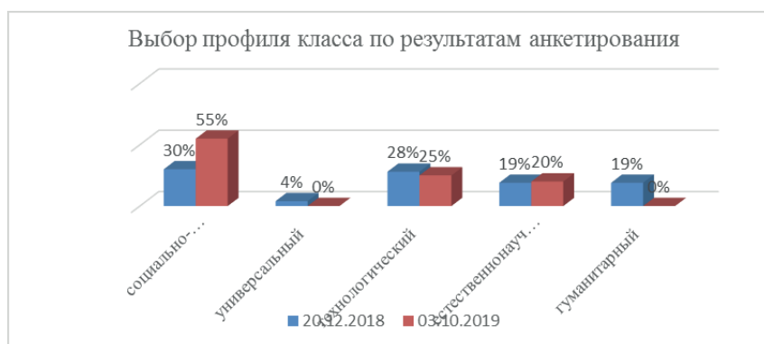
Диаграмма 1 – Выбор профилей 2018-2019 гг.

По итогам анкетирования учащихся 8-х классов от 01.10.2018 г. 20% обучающихся определились с выбором будущей профессии, 64% – нет, 16% – частично. На этот вопрос 28% родителей дали утвердительный, 72% из них – неопределенный ответ. Из предложенных профилей наибольший у учащихся интерес вызвал информационно-математический – 40%, у родителей – социально-экономический и информационно-математический – по 37%.