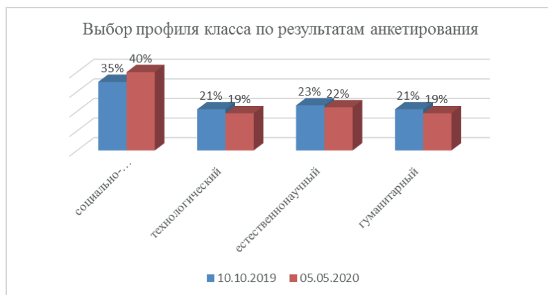
Диаграмма 2 – Выбор профилей 2019-2020 гг.

Чтобы помочь учащимся с определением выбора профиля, были запланированы и проведены классные часы, мастер-классы, профориентационные выезды, встречи с людьми различных профессий, родительские конференции, педагогические советы, различные конкурсы и т.д.