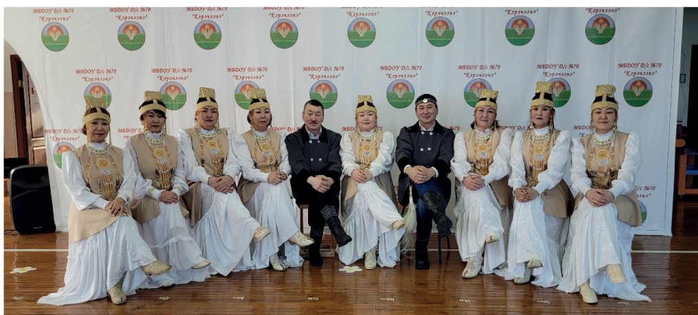
Фото 4 – «Кэрэчээнэ» уһуяан үлэһиттэрэ олонхону куолаан толороллор

Саха төрүт култууратыттан үөскээн тахсыбыт олонхобут – бэйэтэ тыйаатыр. Тыйаатыр искусство бары көрүммүн илдьэ сылдьар искусство буолар. Биһиги олонхобут эмиэ оннук. Ырыа, тойук, уус-уран тыл, үнкүү барыта олонхоҕо баар. Сүрүннээн олонхо – биир артыыс тыйаатыра диэн өйдөбүллээхпит. Оҕолор олонхону театральнай туруорууну олус сэргииллэр. Бу эмиэ ураты үлэ. Манна уһуяан үлэһиттэрэ, төрөпүттэр бары кыттыһаллара хотуулаах буолар. Ол курдук олонхону оруолунан толорууну таһынан, декорация, грим, танас-сап, ырыа-үнкүү толоруута барыта күргүөмнээх үлэттэн тахсар (фото 5).