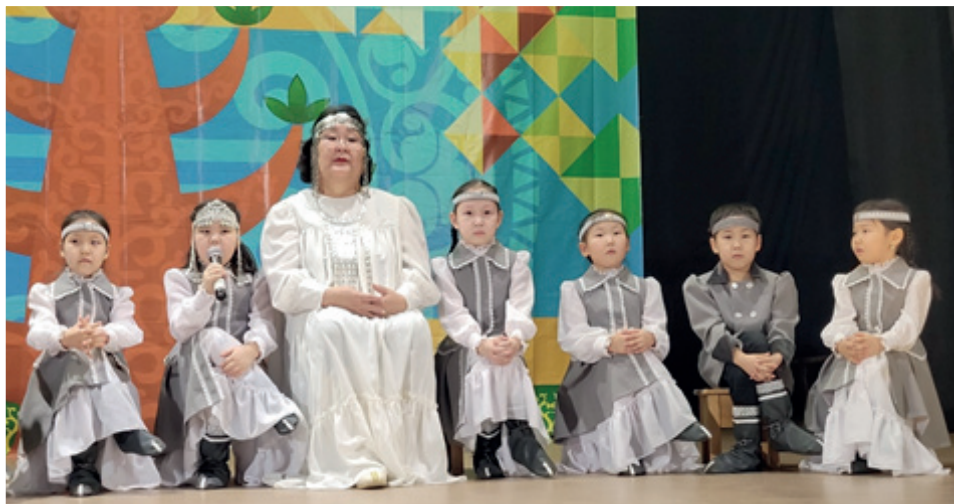
Фото 3 – «Кулунчук» бөлөх толоруутугар «Дьырыбына Дьырылыатта» олонхоттон быһа тардыы