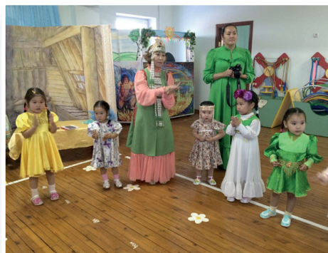
Фото 1-2 – «Айыы ыллыга» уһуяан оёолоро