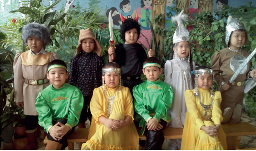
Фото 5 – Биһиги уһуяааммыт араас сылларга уонтан тахса олонхону туруордубут. Оччо олонхону үгэс быһыытынан толордубут.