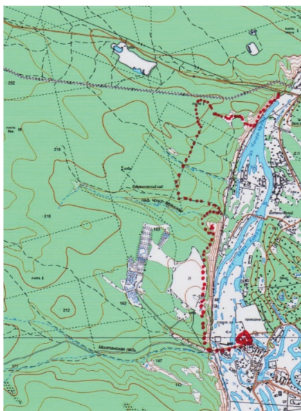
Рисунок 4 – Карта похода выходного дня «Район Птицефабрики – туркомплекс «Царство вечной мерзлоты»

Пройдя поляну, можно спуститься по лестнице вниз к подножию горы.