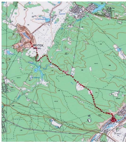
Рисунок 3 – Карта похода выходного дня «Лагерь Спутник – п. Маган»