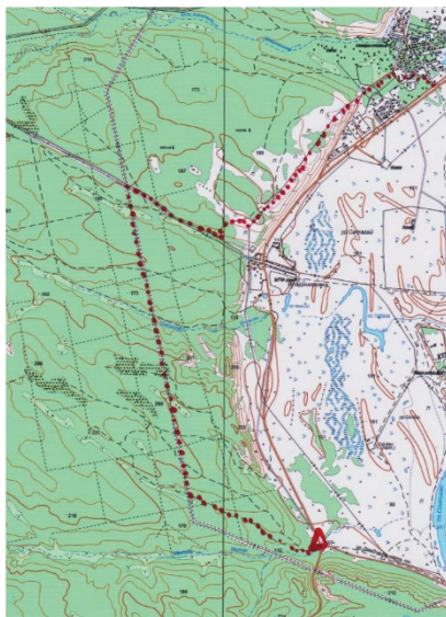
Рисунок 2 – Карта похода выходного дня 25 километр Покровского тракта – 16 км. Покровского тракта