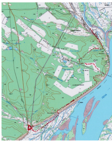
Рисунок 1 – Карта похода выходного дня «37 километр Покровского тракта – п. Старая Табага»