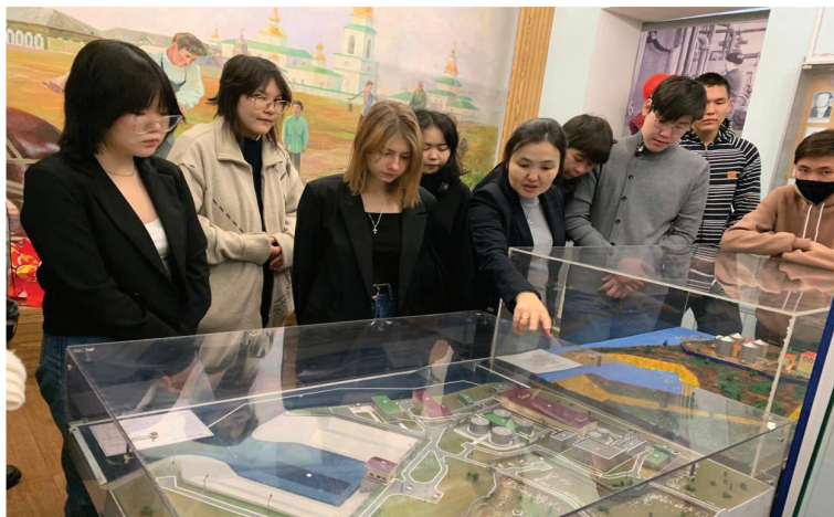
Фото 3 – Профориентационная экскурсия с учениками сети политехнических школ республики в АО «Водоканал»