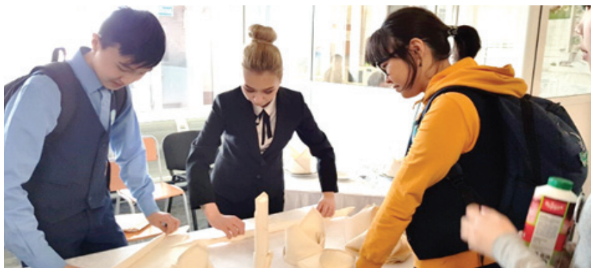
Фото 1 – Мастер-класс по ресторанному делу для старшеклассников в рамках Всероссийского проекта «Билет в будущее» в Якутском промышленном техникуме