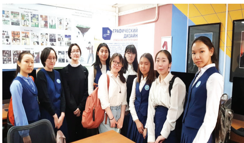
Фото 2 – Профориентационная экскурсия со старшеклассниками в Якутское художественное училище, посещение мастер класса «Графический дизайн»