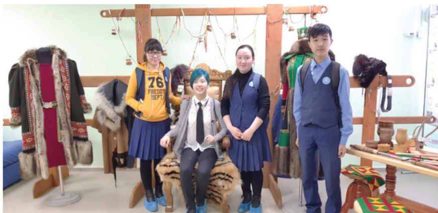
Фото 4 – Профориентационная экскурсия с учениками 10 классов в Якутский колледж технологий и дизайна традиционных промыслов народов Якутии