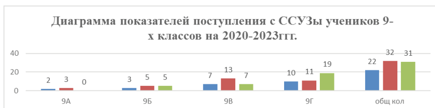
Диаграмма 2 – Динамика показателей поступления