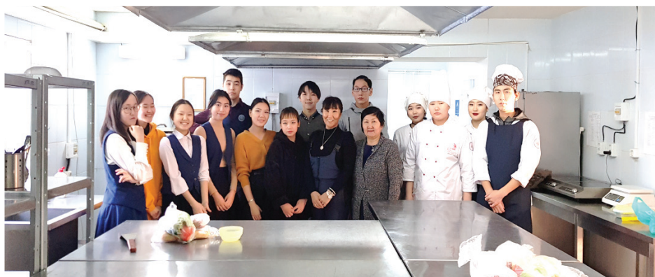
Фото 5 – Мастер-класс для старшеклассников по поварскому делу в Якутском технологическом колледже сервиса