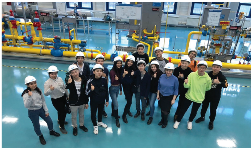
Фото 6 – Выездная профориентационная экскурсия и обучение с учениками физико-технического класса в Национальном исследовательском Томском политехническом университете – старейшем техническом высшем учебном заведении