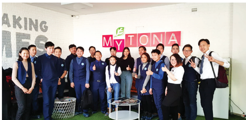
Фото 7 – Профэкскурсия со старшеклассниками в одну из самых успешных IT-компаний – ООО «Майтона»